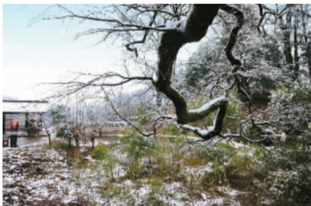
▲这是去年的第一场雪，摄于章水镇。匆匆一年，一晃又是雪天。