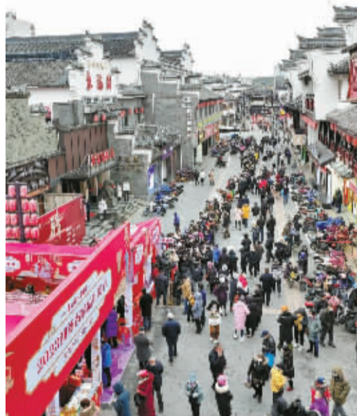
▲多久没有看到排着长队的鼓楼了？风是冷的，心是热的。大家一心想着的不仅仅是年货，还有经历风霜雨雪后更要好好生活的态度。