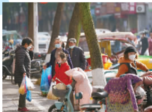
▲年味是一种很玄的东西，哪怕附近没有张灯结彩，没有载歌载舞，你走在街上，看到来来往往的人，看到他们走路的姿态，脸上的表情和手里拎着的东西，你就知道，年要来了。