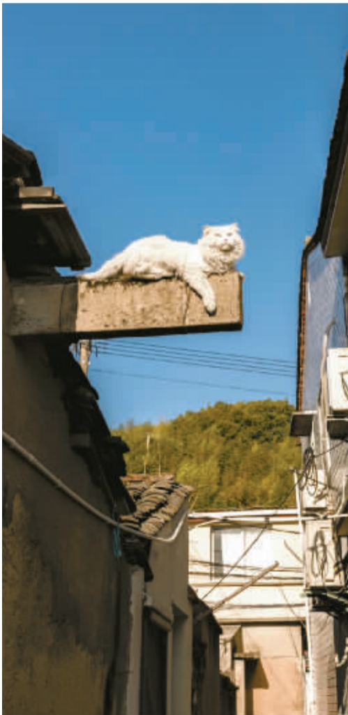
▲这只猫咪找了个好地方晒太阳，我仰望了它很久，它漫不经心地看了我一眼，将目光转向远方。