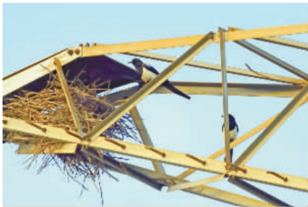
▲今年的喜鹊似乎来得特别早，在慈溪森林公园晨练时听到它们的声音，还以为听错了，一抬头，发现它们竟在一座高高的铁塔上垒窝了！喜鹊报春，是个很好的兆头呢。