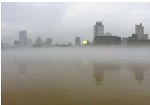
▲很少看到这样的三江口。那天冷热交汇，雾气升腾，闹市区变成人间仙境。

明天就是大寒了。大寒听上去好冷，但大寒一过，就是热气腾腾的年和生机勃勃的春呢。 记者 樊卓婧 文