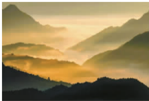
远山黛 吴海平 摄于鄞州金峨山