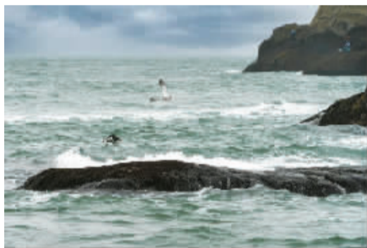
沧浪 曹旗伟 摄于象山渔山岛

沧浪，是江河浩瀚的颜色，包容着群峰之巅方见大海奔涌的高远，和挺立潮头更觉长风浩荡的旷达。