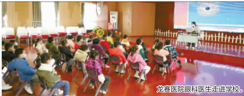
龙赛医院眼科医生走进学校。

近日,龙赛医院的眼科医生们走进区内多所学校,为孩子们带去多场爱眼护眼科普讲座,通过生动有趣的讲解,引导孩子们了解近视的危害和形成原因、爱护眼睛的重要性,以及正确用眼和预防近视的方法,教育并督促孩子们