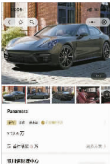
银川保时捷中心上线的Panamera车型。

“保时捷Panamera一般价格都是上百万元,按照正常认识,商家不可能把上百万元的车辆以十几万元出售。因此,‘保时捷事件’应该是基于重大误解而实施的民事法律行为。”至于,商家为什么不以“重大误解”为由取消所有订单,而是称已经与第一个用户达成协议,张晓律师说,这可能是商家出于“商家信誉口碑”以及“后继影响”等多种商业上的考量,做出的公关行为。