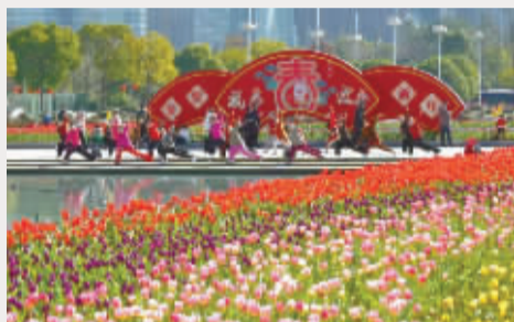
▲水贵仙 摄于鄞州区府广场

迎接新年的第一片姹紫嫣红,郁金香开得那么好,今年不再辜负美景,把春游的计划都提上日程吧。