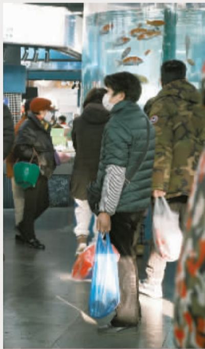
▲水贵仙 摄于国际会展中心

迎接新年的第一场毕洽会,这三年很多企业年轻人都不容易,希望这场青春与梦想的对接皆大欢喜,希望所有的波折,都是好事多磨。