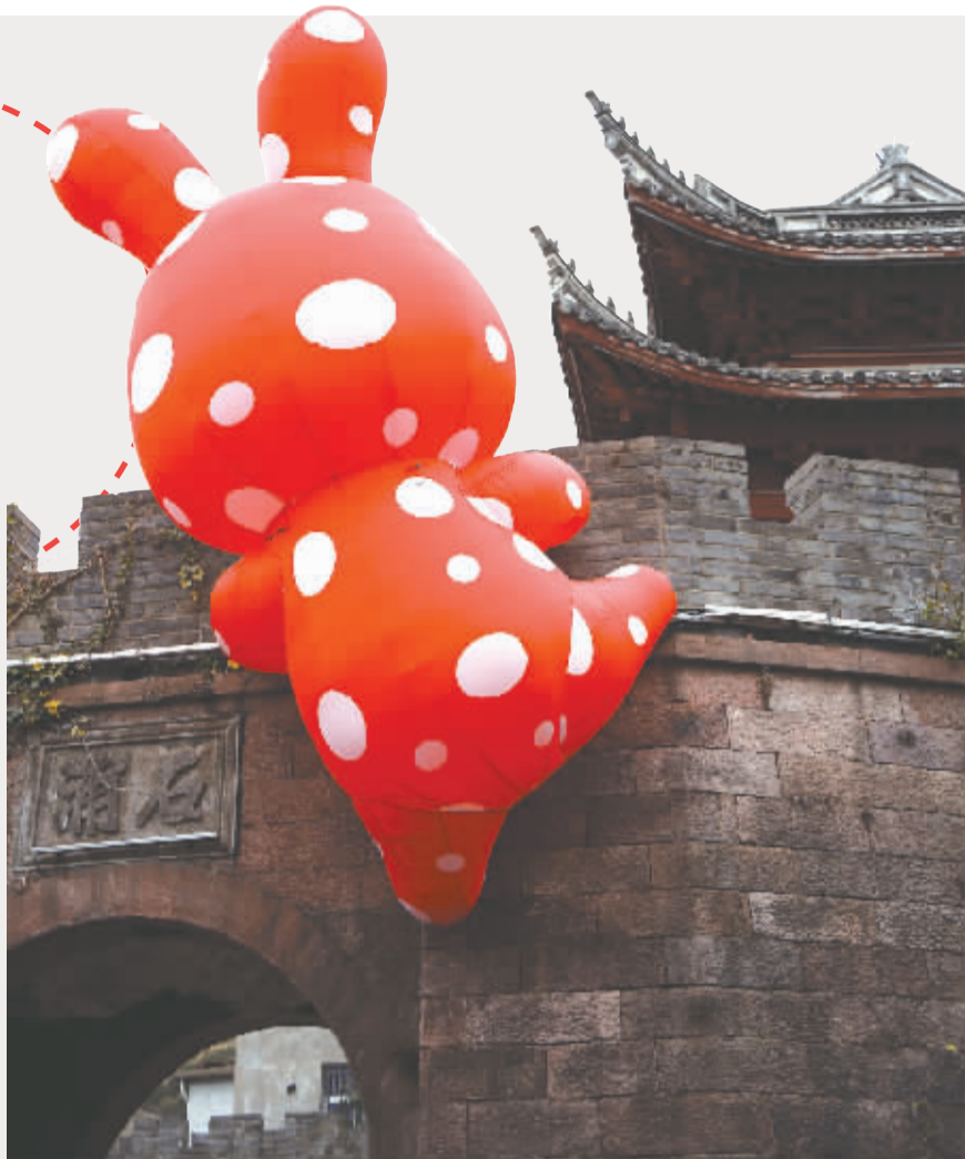
▲蒋萍萍 摄于象山石浦