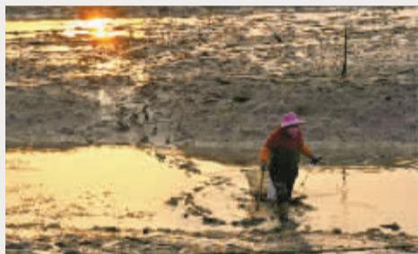
▲一鸣惊人 摄于象山黄避岙

迎接新年的第一片姹紫嫣红,郁金香开得那么好,今年不再辜负美景,把春游的计划都提上日程吧。