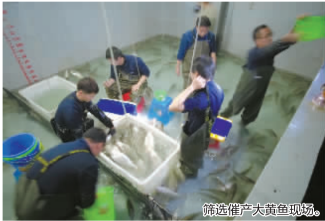
筛选催产大黄鱼现场。

2月8日,位于象山县黄避岙乡的大黄鱼繁育基地一片热火朝天,宁波市海洋与渔业研究院专家们置身鱼池,努力挑选优质的鱼爸鱼妈进行催产,助其生产“高质量鱼宝宝”。