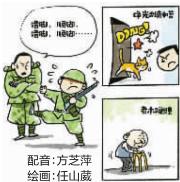
配音：方芝萍 绘画：任山葳