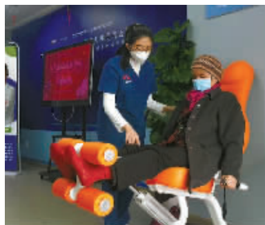
老人在专业康复师(左)指导下进行运动康复。

据介绍，接下来钮曼运动康复中心还将联合多家国内三甲医院，开展关于长者运动康复的科研工作，探讨运动对长者生理健康和心理健康的影响，以及如何提高长者运动康复的效果。研究结果可以为长者运动康复服务的提高提供重要的科学依据。未来，该中心将逐步建立长者个性化运动健康电子档案，依托“互联