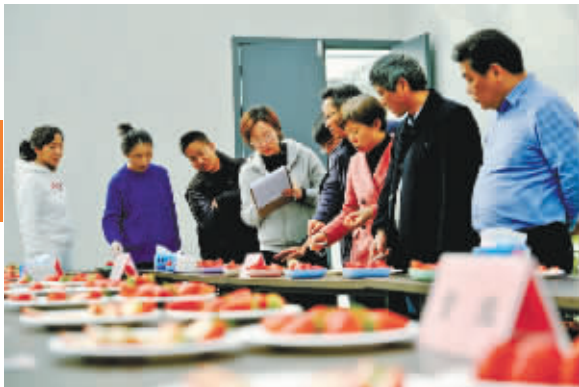
专家评审现场。

昨日,2023年宁波精品草莓推选活动在位于奉化区岳林街道的文创智慧农业有限公司举行,全市50多家农场选送的10多个品种、近90个样品现场比拼。