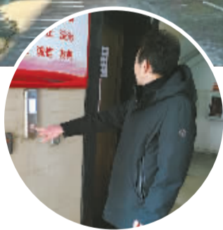
◀时隔8年多，电梯重新运行。