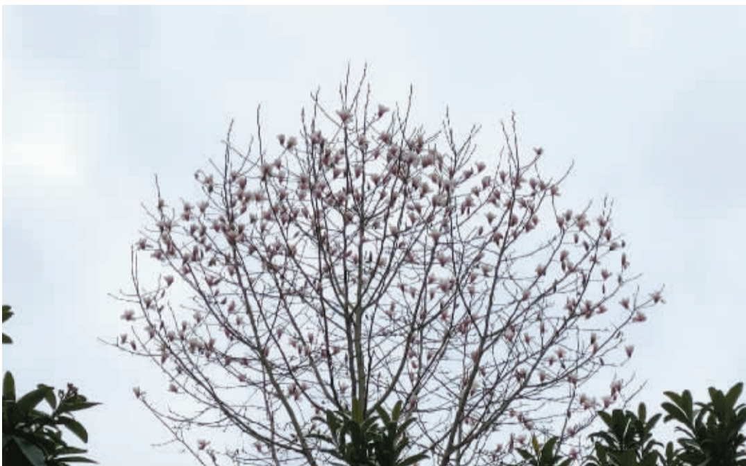
阴沉天空下绽放的玉兰,透露出春的气息。