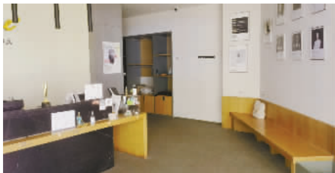
万象汇梵音瑜伽馆现场。

最近,宁波目前唯一的梵音瑜伽门店关门停业,引发了众多消费者和网友投诉。而该品牌在全国的很多门店也在一夜之间关门停业。记者就此进行了实地采访调查。