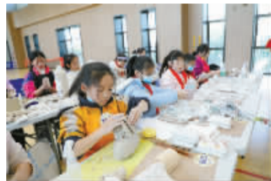
小选手现场制作陶艺作品。