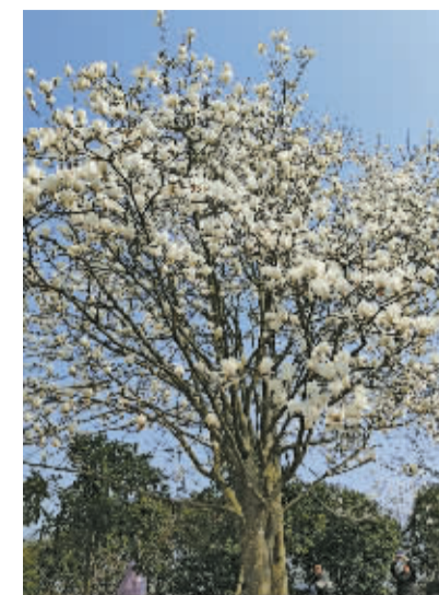
奉化长岭村,玉兰开到了最好的时候,那么多人赶来,举头看一树繁花,原来白色,也可以这么生机勃勃,热热闹闹。

一个冒失鬼哗啦啦地打破平静,有人感慨:“春江水暖鸭先知”,这家伙若听到,说不定会翻个白眼,“人家才不是普通的鸭子,人家叫‘鸳鸯’。”