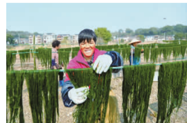
早春是挖海苔的时节,潮涨潮落间,湿漉漉的翠色在春风里绵延不绝,又是有趣有味的一年。