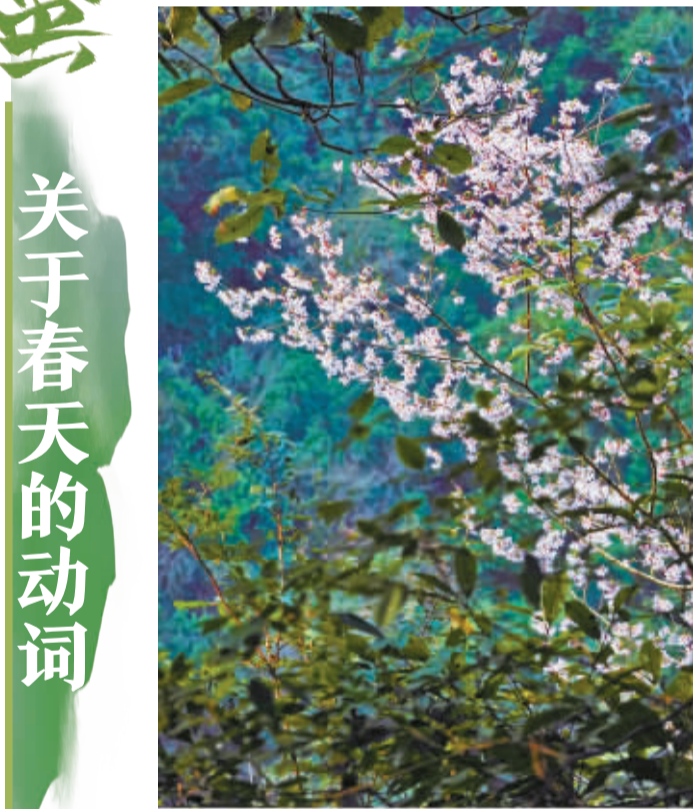
山里的野樱开花了,安安静静,与世无争的样子。走近了看,每一朵花都开得那么努力,每一朵都是一个独一无二的春天。