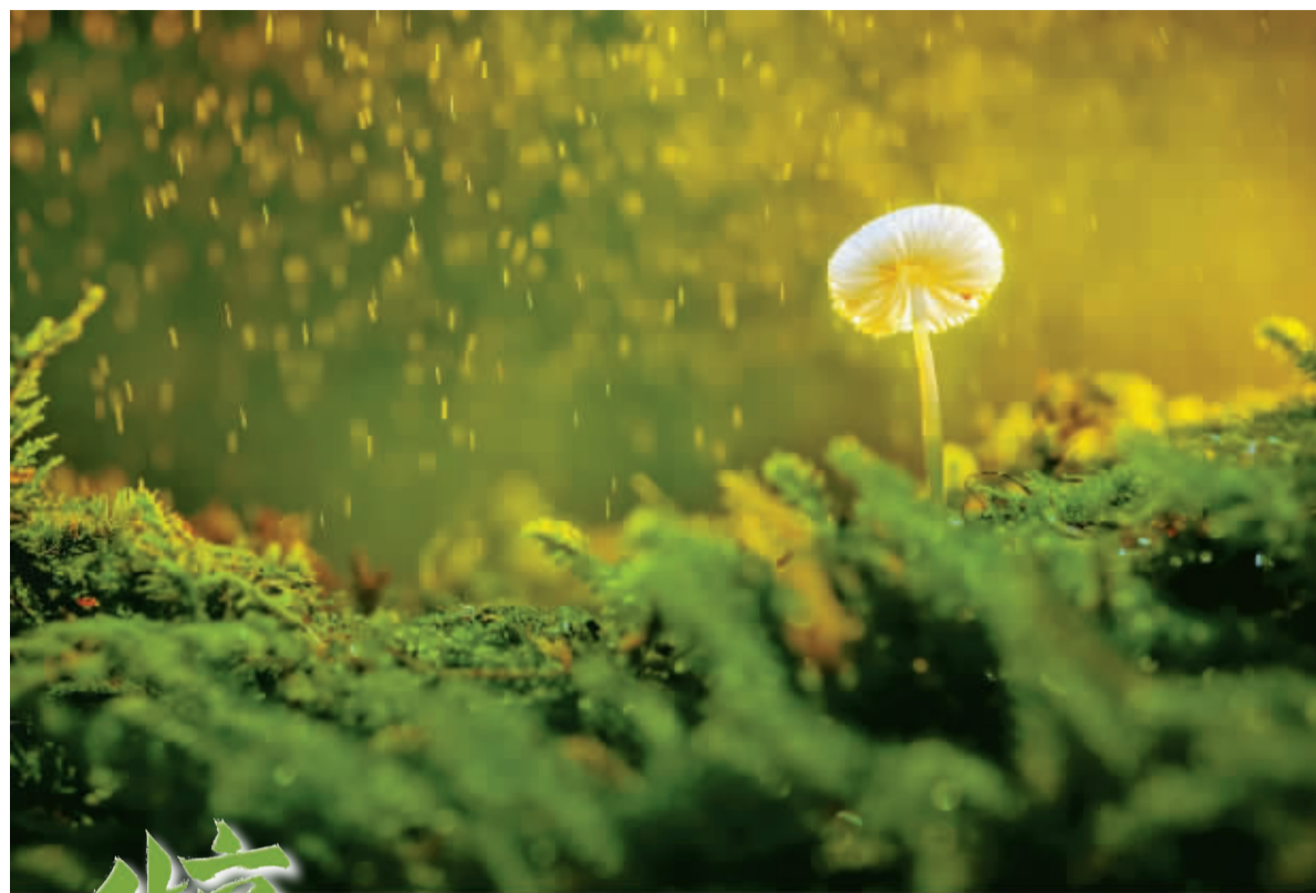
在连绵的“雨水”和明朗的“春分”间,水流花开,草长莺飞,新生命探出脑袋,冲阳光温柔地点了点头。