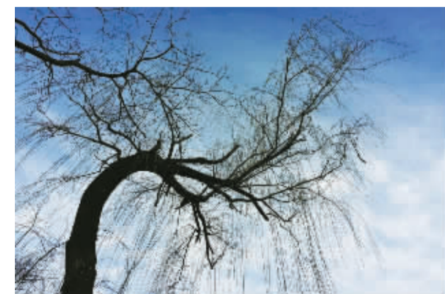
晨跑经过绿岛公园,偶遇一棵风姿绰约的树,万条垂下,若隐若现的点点绿意随风摇曳。染柳如烟,又是一个江南的春天。