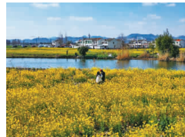
镇海骆驼,这应该是宁波最早的油菜花海,很快,一茬接一茬的耀眼金黄,会把远山、河流、田野、村庄,还有相爱的人围在一起,将春天打个包。