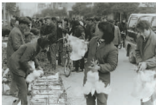
▲ 1994年，奉化广平路集市，一位主妇熟练地抓起两只鸡反复比较。现在这样的场景几乎看不到了，据说不少孩子第一次见到活鸡是在动物园里。