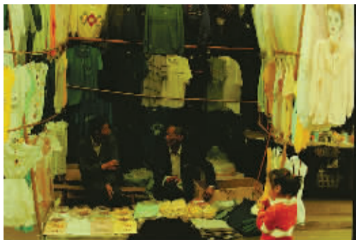
▲ 1998年，商场对多数家庭来说还是一个高档场所，很多90后童年的新衣都来自这样的摊位。