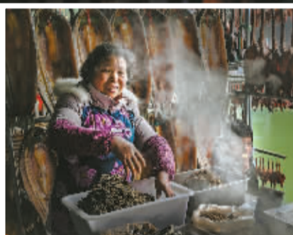
▲ 每一个集市都有独特的味道，2018年，被这位阿姨的笋丝干菜鱼鲞烤肉吸引，到现在都记得那个香。