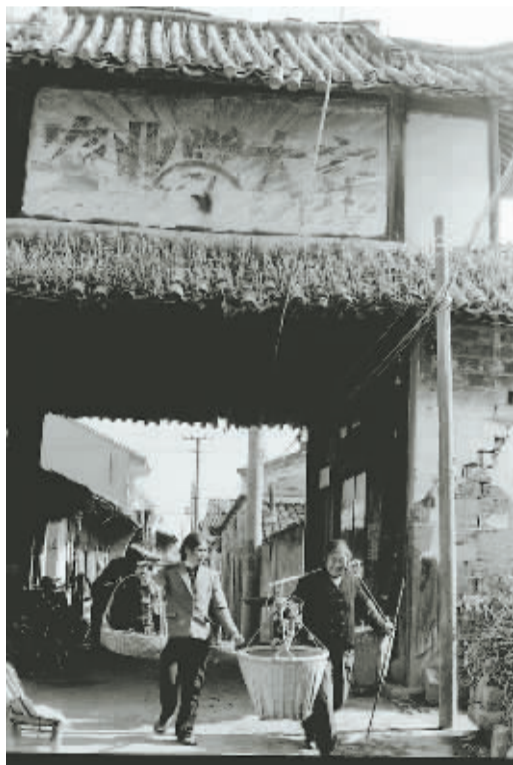
▲ 1984年，挑着竹筐去集市摆摊的农妇经过奉化西锦楼，门楼上的“农业学大寨”留下了鲜明的时代印迹。