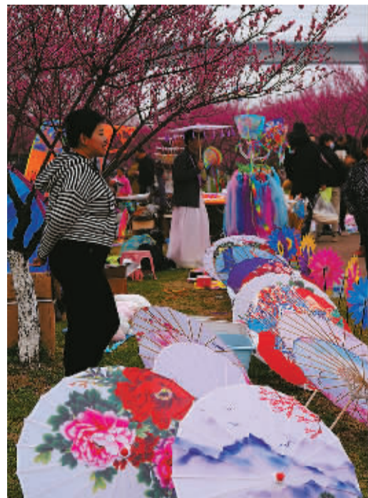
▲ 2023年，春回大地，镇海永旺村游人如织，梅花树下是各种新鲜小玩意儿。

这届父母很慷慨，只要孩子喜欢，多半会毫不犹豫买买买。这不仅是给孩子买，也是给童年的自己。他们知道有些东西从来没有变过，摊上的这些小零碎未必有多好，但可以让并不容易的日子生机勃勃充满活力。