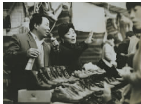
▲ 2000年，奉化惠政路街头集市的一对夫妻档。男的拿着话筒用快板吆喝，女的伸出四个手指：一双40元，只要40元。