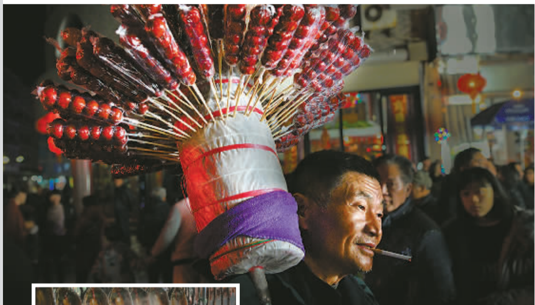
▲ 不管哪个年代，哪个地方，那一束热烈甜蜜的中国红永远是集市的标配，也是流动中的C位。