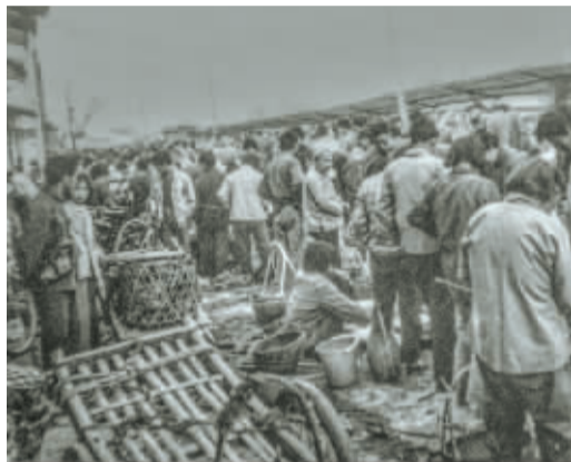
▲ 1983年，奉化桥脚埠头的集市，手拉车和竹箩组成了一个摊位，人来人往，摩肩接踵。

这是过去数十年摄影师方亚琪拍摄的大大小的集市，他在整理时很感慨：再小的摊位，都在用尽全力经营，再简陋的商品，总有人为之眼前一亮，小生意微不足道，但渊源流长，韧性十足，随着时代一起，热气腾腾地向前——