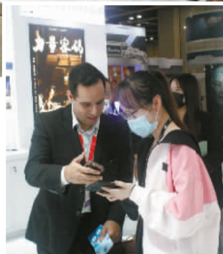
宁波影视企业与外国客商现场洽谈。