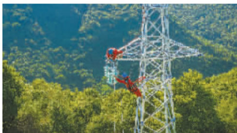
截至2022年底，宁波电网建成110千伏及以上线路8821公里，相比十年前增加40%，全力保障宁波经济社会发展的用电需求。