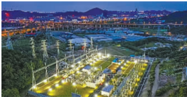
2020年，500千伏钱湖变投运，这是宁波第九座超高压变电站。