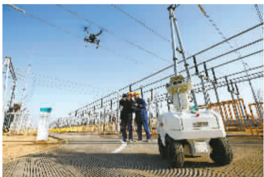
智能巡检机器人“上岗”。