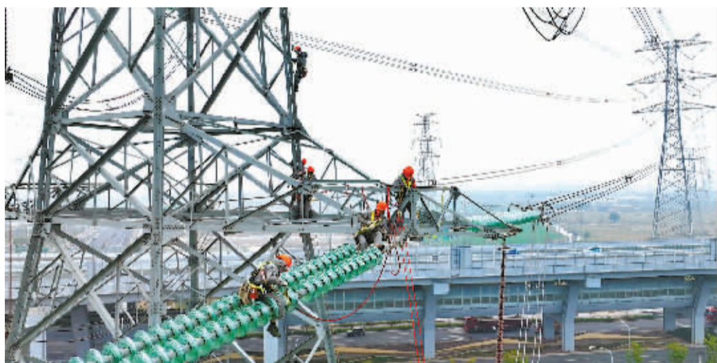
开展巡检工作。