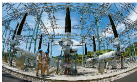
2016年，宁波首座500千伏智能站投运，加速浙江电网智能化。