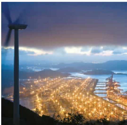
▶ 宁波舟山港穿山港区华灯初上，智慧电力涌动发展活力，描绘着东方大港的海上丝路传奇。