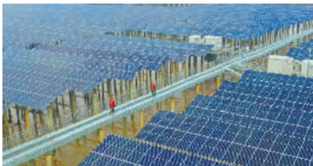
2021年，象山长大涂光伏项目并网发电，象山1号海上风电项目投运。十年间，宁波清洁能源装机容量位居全省第一。