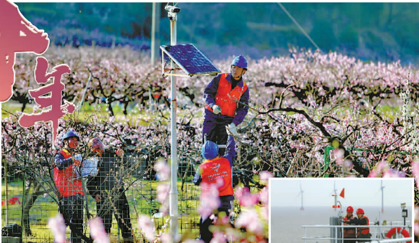
2023年，“花海打卡”催热了新一波“旅游经济”，用电无忧成了电力人的心头大事。

这十年，宁波市电网投资累计487亿元，助力甬城经济社会高质量发展。这背后离不开电力工作者的付出。我们整理了一组照片，见证了一代代甬电人“上天入地”，创造了一个个不凡成果。