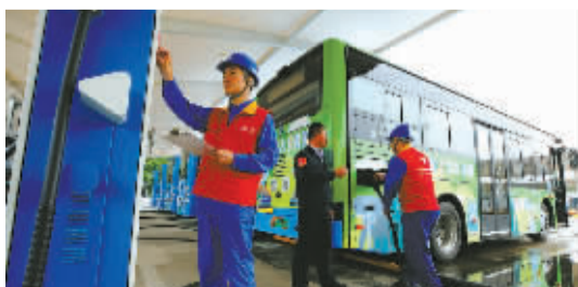
2022年底，宁波150余个乡镇街道实现充电站“镇镇通”。