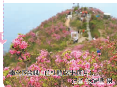
奉化区金峨山的杜鹃(资料图片)。

北仑区柴桥街道 宁海县茶山东海云顶 海曙区龙观乡五龙潭 鄞州区福民公园、明楼公园 奉化区金峨山、溪口镇蒋氏故居杜鹃谷