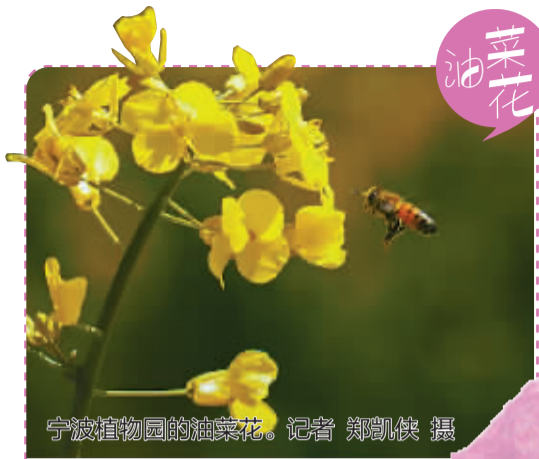
宁波植物园里的油菜花。

奉化区萧王庙街道林家村“天下第一桃园”、溪口镇新建村、尚田镇下坂村、莼湖镇艾湖村 象山影视城桃园,象山县涂茨镇、泗洲头镇杨大场村 宁海县胡陈乡中堡溪村(东山村) 慈溪市掌起镇古窑浦村 海曙区高桥镇望江村、龙观乡雪岙村桃园 江北区槐树公园 鄞州区鄞州公园、东钱湖十里四香桃林