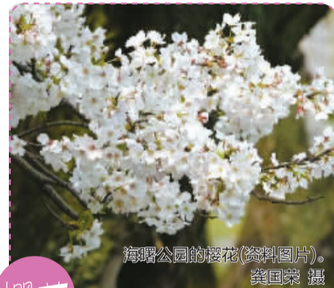
海曙公园的樱花(资料图片)。