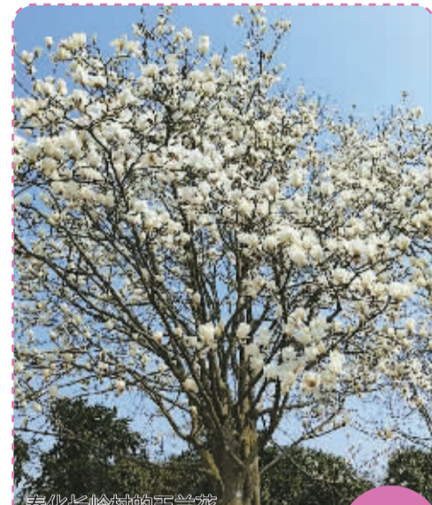
奉化长岭村的玉兰。