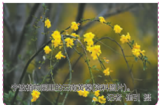
宁波植物园里的云南黄馨(资料图片)。