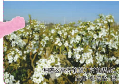
海曙区高桥镇望江村的梨花。

鄞州区东钱湖梨花岙、东钱湖陶公山利民村 镇海区庄市街道光明村 慈溪市周巷镇 象山县鹤浦镇南田墩村、涂茨镇新塘村 海曙区高桥镇望江村