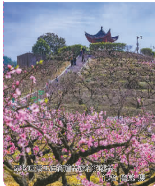
奉化区萧王庙街道林家村的桃林。

奉化区西坞街道税务场村、溪口镇新建村 江北区慈城镇陈村 宁海县许家山石头村、桑洲镇南岭村、强蛟镇骆家坑村 象山县西周镇文岙村、涂茨镇汤岙村、钱仓村、高塘岛乡花岙岛 北仑区春晓镇永年塘、小香塘 海曙区古林镇茂新村、高桥镇望江村、鄞江镇它山堰 鄞州区姜山镇狮山公园、云龙镇云龙村、东钱湖十里四香绿野香村、奉化江东岸花海公园 奉化区溪口镇新建村、大堰镇西岙村 江北区甬江街道北郊片区、慈城陈村 前湾新区湿地公园