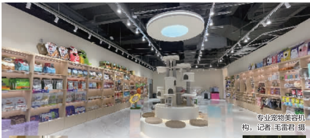
专业宠物美容机构。