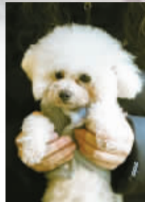
美容后 受访者供图