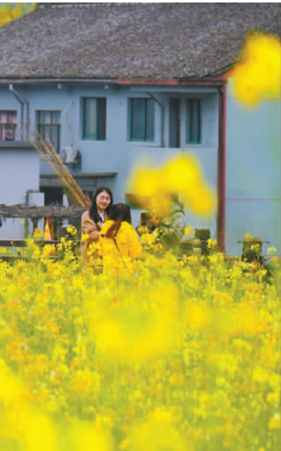
媒体大咖在鄞州三塘村油菜花海采风。