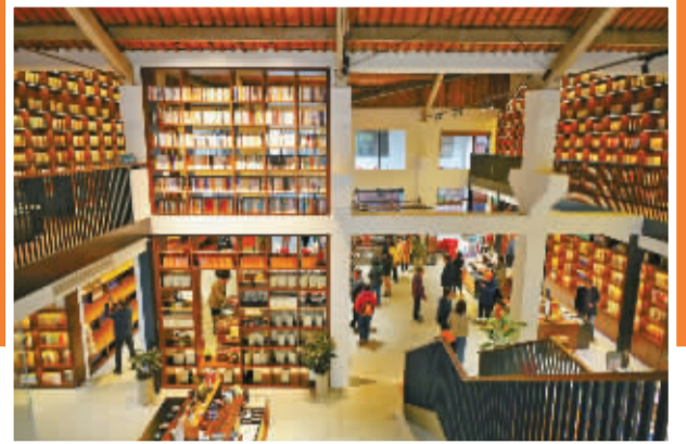
感受三塘村的变化。