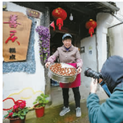
在天童老街体验特色美食。

如何避免“千街一面”？一行人看到了艺术赋能、还街于民的创新探索。行走在天童老街，一片喧腾景象跃入眼帘，沿线粉墙黛瓦高低绵延，木门“吱呀”开合间飘出麻糍的香甜、牛肉面的浓香、乌米饭的馥郁。