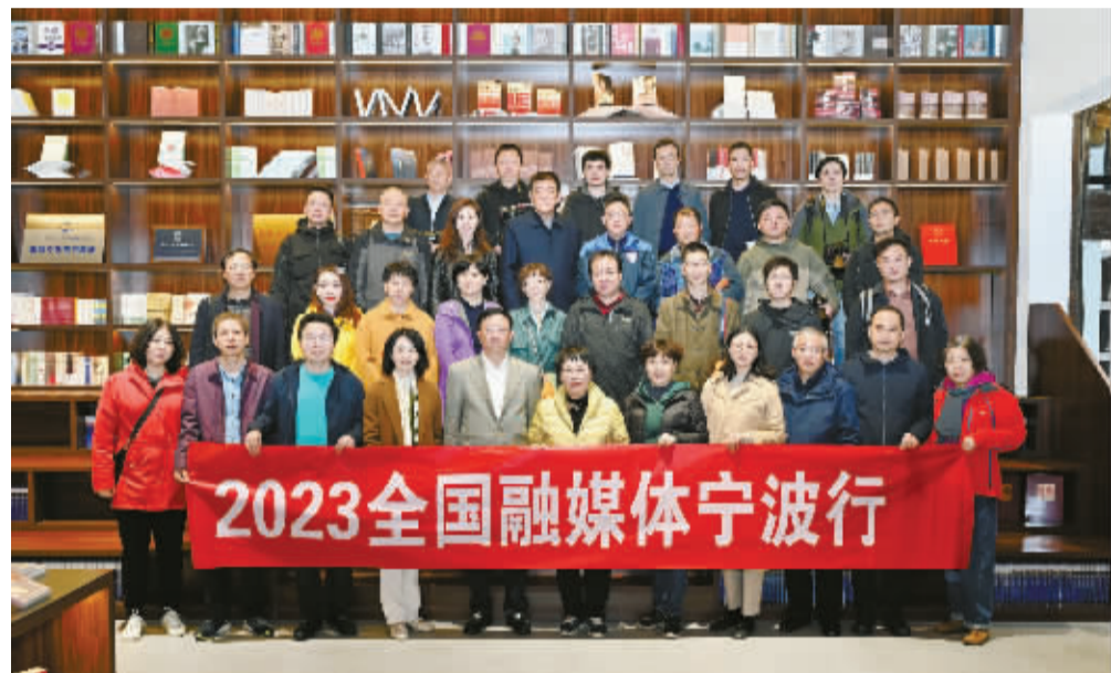
媒体大咖在东吴镇合影留念。