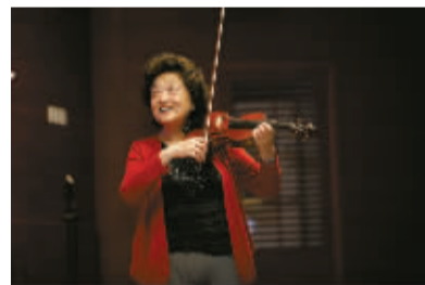
俞丽拿在宁大音乐学院大师课上亲身示范。