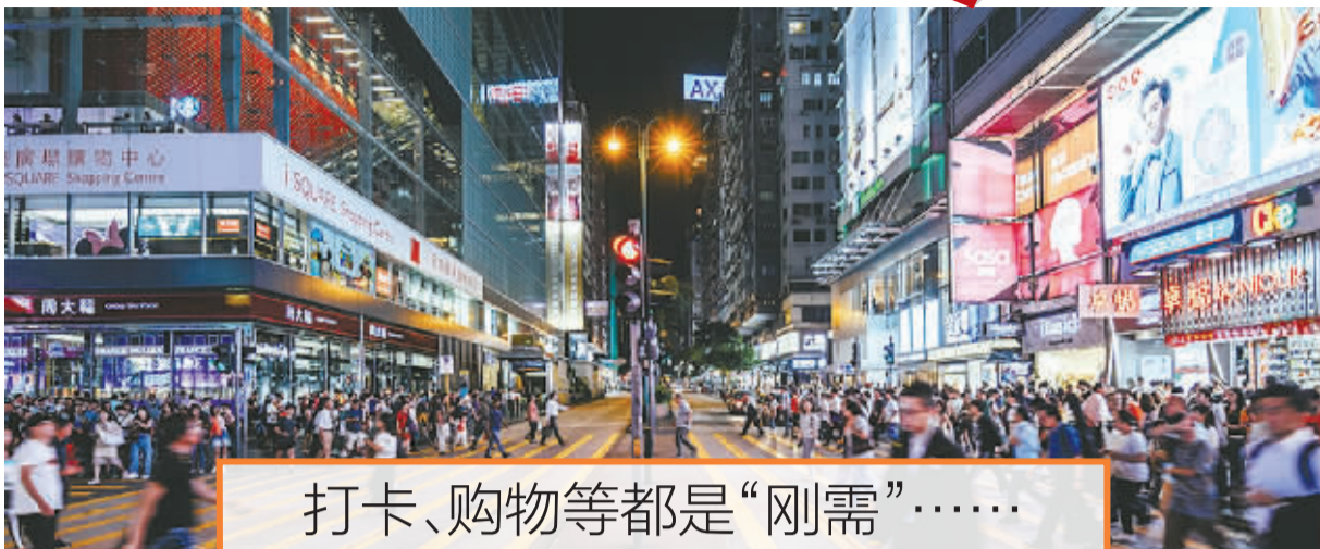
热闹的香港街头。