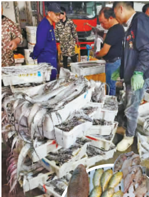
▲ 宁波水产品批发市场大水产交易区的摊位。

作为海鲜消费大市的宁波，面对不一样的休渔季，将发生哪些改变？记者昨日探访了宁波水产品批发市场。