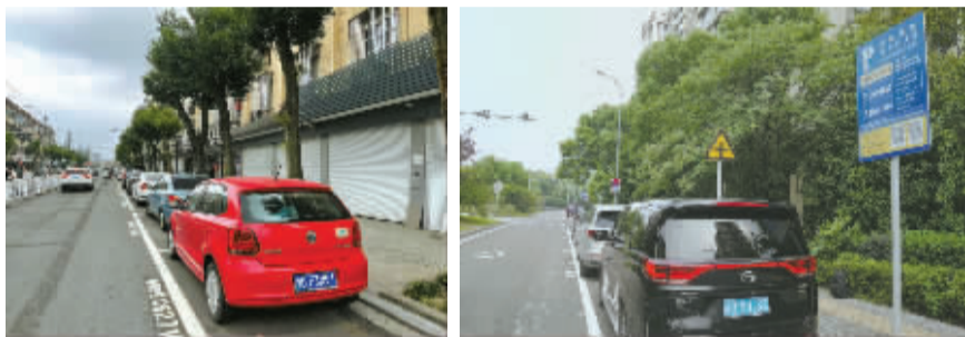
甬城泊车给市民带来了极大便利。