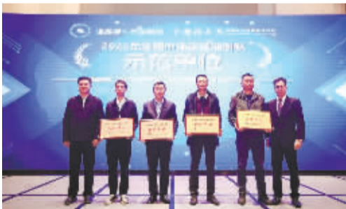
宁波市政公用投资有限公司获2022年度城市停车管理创新示范单位(右三)。

过去三年,甬城泊车先后入选宁波市数字化改革改革先锋,获得宁波市数据开放应用大赛二等奖;2022年被省住建厅确定为浙里城事共治重大应用首批进行全省贯通场景,入选宁波市首批共同富裕最佳实践和培育案例名单,入选2022年度宁波市数字化改革成果最佳应用(标识类)。