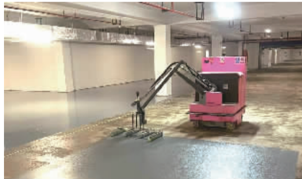
慈溪泊蔚里工地上地坪漆涂敷机器人自动作业

房地产行业产品力的提升,科技建造在其中发挥的力量不可忽视。据介绍,碧桂园智慧建造去年全面落地,截至今年2月,共有28款博智林自主研发的建筑机器人入驻项目一线,投入商业化应用,在全国30个省