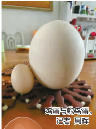
鸡蛋与鸵鸟蛋。