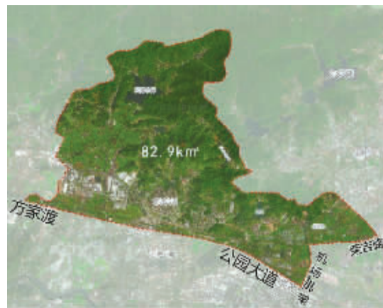
据公示信息附图结合资规部门“天地图·宁波”标绘,仅供参考,最终以批后公布规划为准。