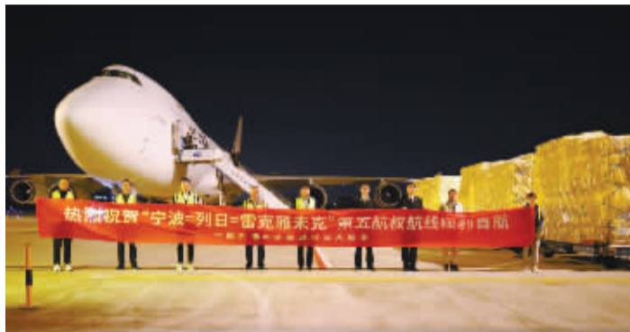
CC613航班抵达宁波机场。

5月9日凌晨2:22,从冰岛雷克雅未克起飞的CC613全货机航班,搭载78吨仪器仪表、备品备件、服装等货物,在比利时列日中转后,抵达宁波栎社国际机场。这条“宁波=列日=雷克雅未克”的货运航线,是宁波机场开通的首条连通欧洲的“第五航权”洲际货运航线。