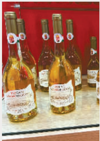
来自匈牙利的酒水。