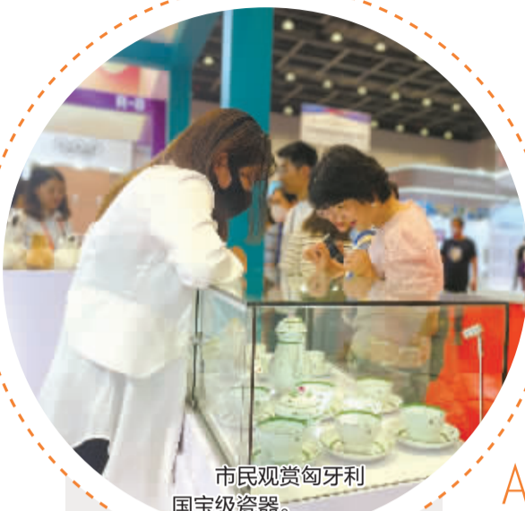
市民观赏匈牙利 国宝级瓷器。

源自3500年前，天然有机的希腊西红花茶；采自地中海200米深处的天然海藻绵；至今仍按照传统手工生产和上漆制造的国宝级陶瓷；来自“世界牙科之都”匈牙利的口腔诊疗技术……5月16日，第三届中国—中东欧国家博览会在宁波拉开帷幕。