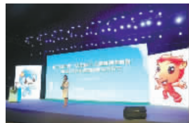
“中东欧十大最喜爱消费品”评选发布现场。