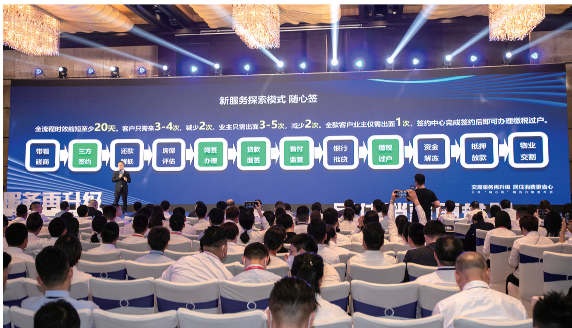
贝壳宁波“随心签”服务升级

对于宁波二手房买卖的购房者来说,在“随心签”服务的升级下,可直接少跑2次,少等20天,大大提升了房产交易效率。