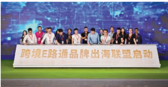
“跨境E路通”成立仪式。