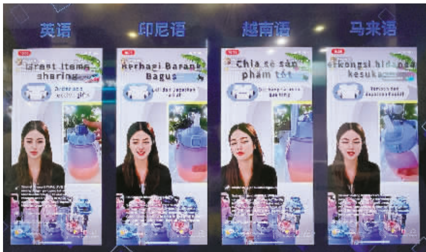
数字人直播。

据悉，宁波跨博会首日，观展人数达28819人次，更有200余名国外意向采购商与会洽谈。现场，中国（宁波）跨境电商出海联盟同宁波跨博会签订20亿元的意向直采合约，让全国各地的参展企业满载而归，高呼“来值了”。