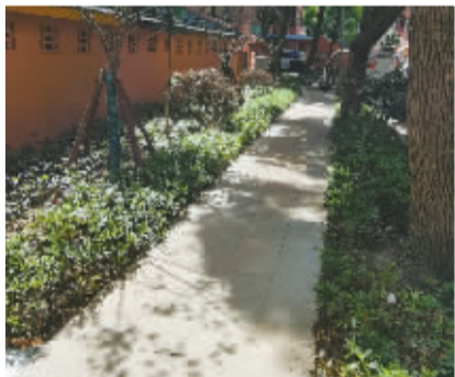
甬港新村入口处项目现状和效果图对比