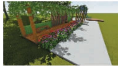
世纪花园项目现状和效果图对比