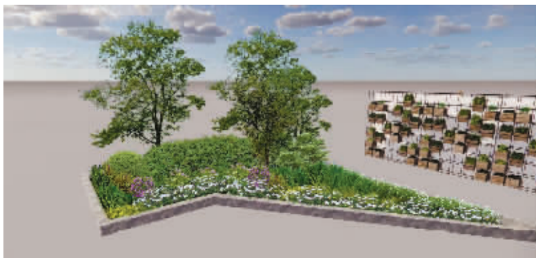
南裕小区项目现状和效果图对比