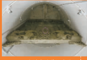
水塔内的牌坊残件。