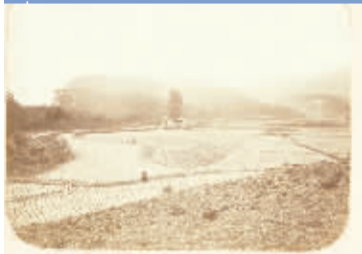
远景枫树后即青锁桥。