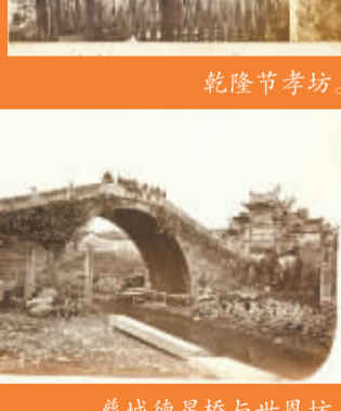
慈城德星桥与世恩坊。