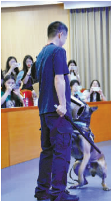
缉私犬演示如何制服嫌疑人。

各种毒品会伪装成什么样子出现在大众视线？缉私犬们平时是怎么寻找违禁品，并协助海关缉私警察追捕嫌疑人的？在“6·26”国际禁毒日来临前夕，一场生动的禁毒宣传活动在浙江万里学院上演。