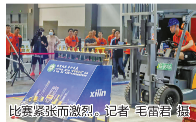
比赛紧张而激烈。