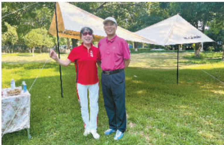
夫妻俩在社区活动中合影。

今天，我们要向大家推荐一对来自鄞州区潘火街道的“木球伉俪”，看他们如何用运动点亮“夕阳红”。