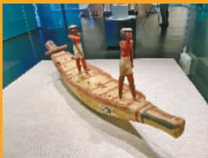
3000年前的古埃及船模型。