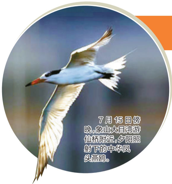
7月15日傍晚,象山大目湾游仙桥附近,夕阳照射下的中华凤头燕鸥。

今天 多云到阴,午后局部阵雨 27℃-34℃ 明天 多云到阴,午后局部阵雨 26℃-35℃