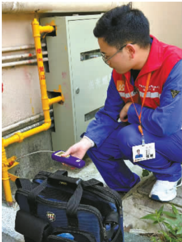
高温天依然24小时在线。

今年3月1日,华润兴光燃气选择出租率高、燃气安检率偏低、隐患多风险大的江北区翠东小区,进行全市首个“燃气管家”试点。至6月底,试点范围已由江北区延伸至海曙区,社区数已经增加到6个,安检率、隐患整改率动态跟踪,其中翠东社区安检率已达100%。