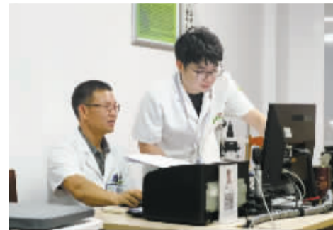
北仑区二院的“青廉”风险防控安全员在眼科督查廉政风险隐患。