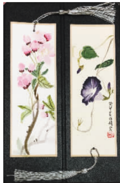
镇海区骆驼中心学校405班 郑旖宸(证号2331015) 指导老师 袁娜