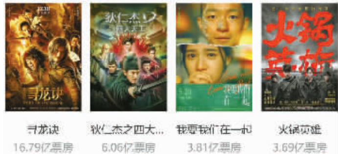
工夫影业代表作品。据猫眼