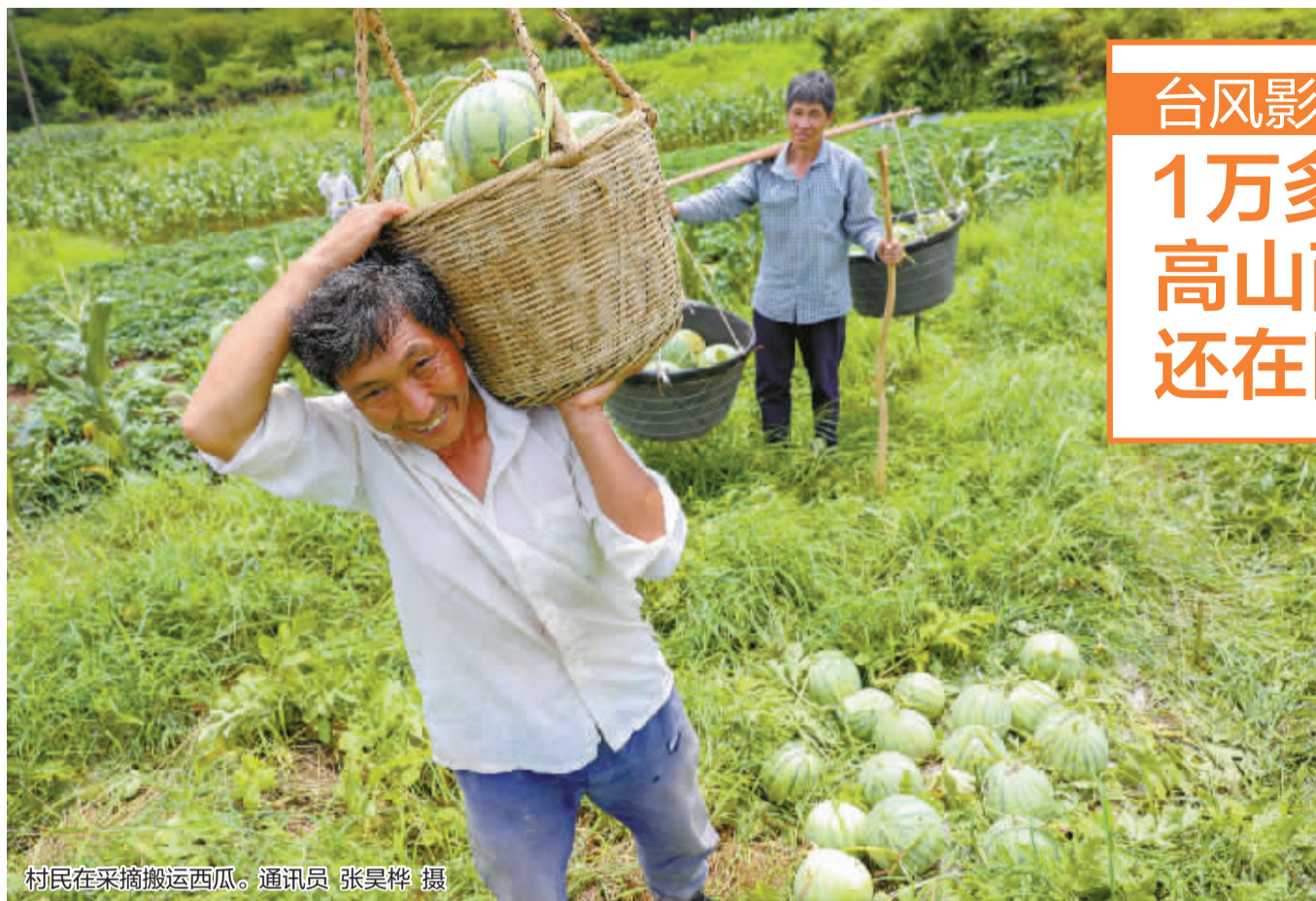
村民在采摘搬运西瓜。