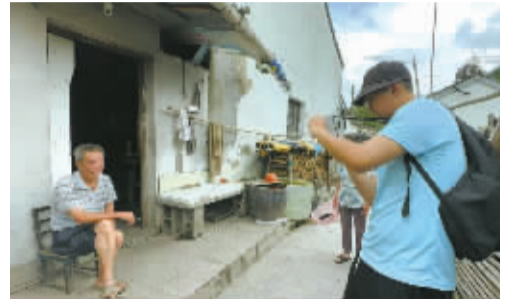
调研队员为北溪村老人拍照。

未来，“山里有茶”还将结合深溪村的特产与文化，推出更多深溪文创产品。调研队员们手中捧着的竹筒奶茶就是她推出的新产品。