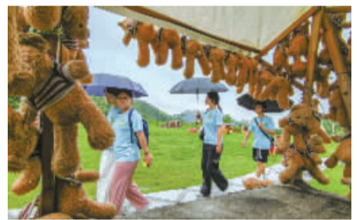
队员们在深溪村走访。