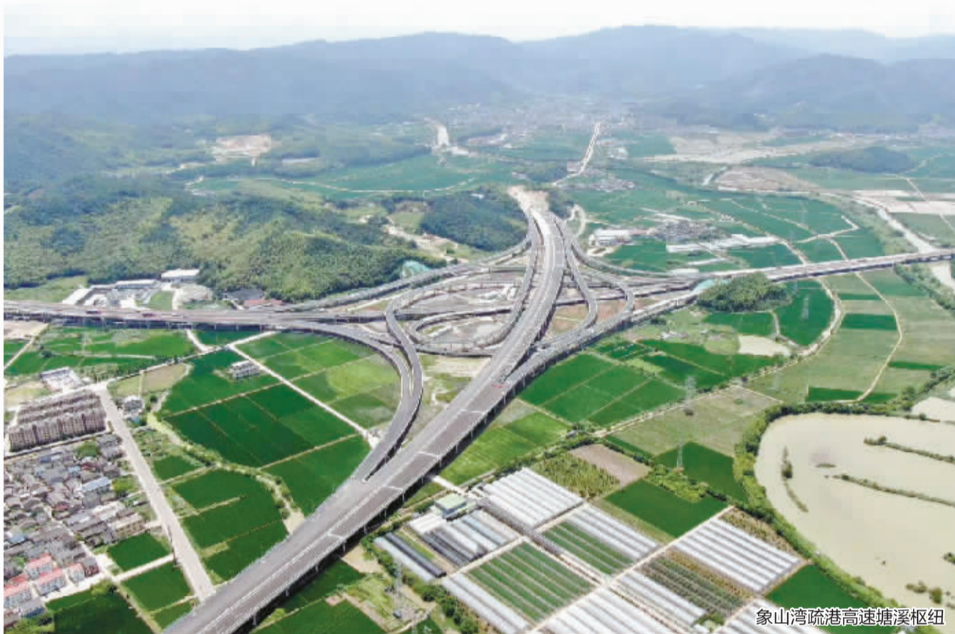
象山湾疏港高速塘溪枢纽