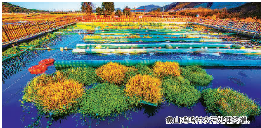
象山鸡鸣村农污处理终端。

市住建局深入乡镇(街道),针对性开展调研指导服务,把发现问题补短板、整改任务促提升作为调研工作的出发点和落脚点,取得了良好成效。目前,全市城乡风貌省民生实事项目,总体进展率达到93.85%;新一轮现代化美丽城镇建设已全面开启,项目开工率达到97.29%;全市农村生活污水治理提质增效,行政村覆盖率达到91.57%,其中列入省政府民生实事的145个新建农污处理设施进展率为92.97%。