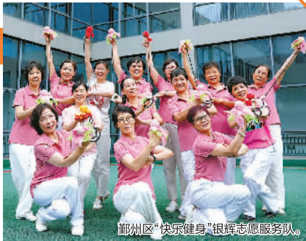
鄞州区“快乐健身”银辉志愿服务队。

小小的健身球,在她们手里不停飞舞、穿梭,犹如一只只美丽的蝴蝶;一群“娘子军”,自学成才,在健身球操领域拿奖拿到手软;一支平均年龄64岁的快乐健身队,在健身时还不忘公益,并将健身球操这一运动带给了更多热爱运动的朋友。