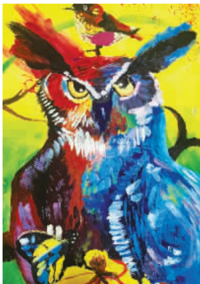
镇海区贵驷小学402班 谢雅楠(证号2331207)指导老师 刘颖