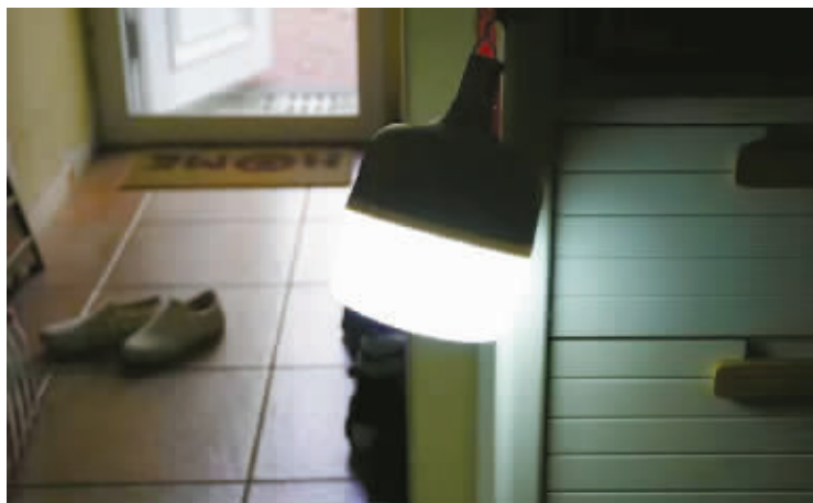
客厅门口放着一盏应急灯用来照明。