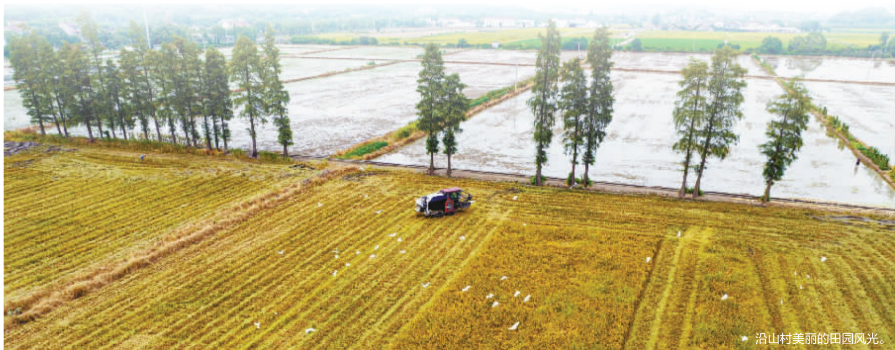
沿山村美丽的田园风光。