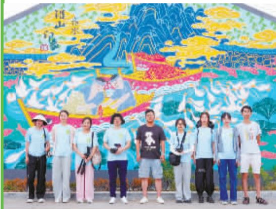
调研队员在沿山村的农民画前合影。